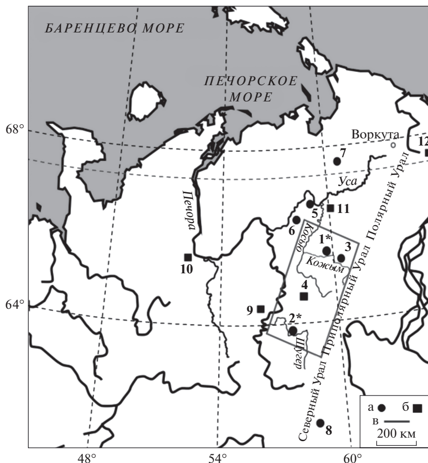
Рис. 1. Географическое положение местонахождений.

а – пещерные местонахождения, б – озерные и речные местонахождения, в – национальный парк “Югыд-Ва”. Местонахождения: 1 – Кожым-1, Кожым-2; 2 – Шугер-1, Шугер-2, Шугер-4; 3 – Соколиный (Пономарев, 2005); 4 – Вангыр, Межгорное (Kultti et al., 2003); 5 – Уса-2 (Кряжева и др., 2018); 6 – Шарью-1 (Кряжева и др., 2016); 7 – Пымва-Шор (Смирнов и др., 1999); 8 – Черемухово-1, Усольцевская пещера, Каква-4 (Лаптева, 2009); 9 – Дутово (Немкова, 1976); 10 – Карпушовка (Никифорова, 1979); 11 – бугристые торфяники (Пастухов и др., 2017); 12 – Малая Хадата, Большая Лагорта (Сурова и др., 1975), Черная горка (Jankovska et al., 2006), оз. Перевальное (Панова и др., 2003), Рай-Из (Кошкарова и др., 1999). Звездочкой выделены впервые изученные в настоящей работе местонахождения.