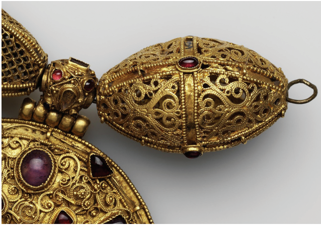
Рис. 3. Ожерелье. Деталь. Fig. 3. Necklace. A detail.

аналогичных боковым бляхам первого ожерелья, и пяти “завитковых” бусин. Таким образом, эта реконструкция позволила использовать все найденные в кладе бусины.