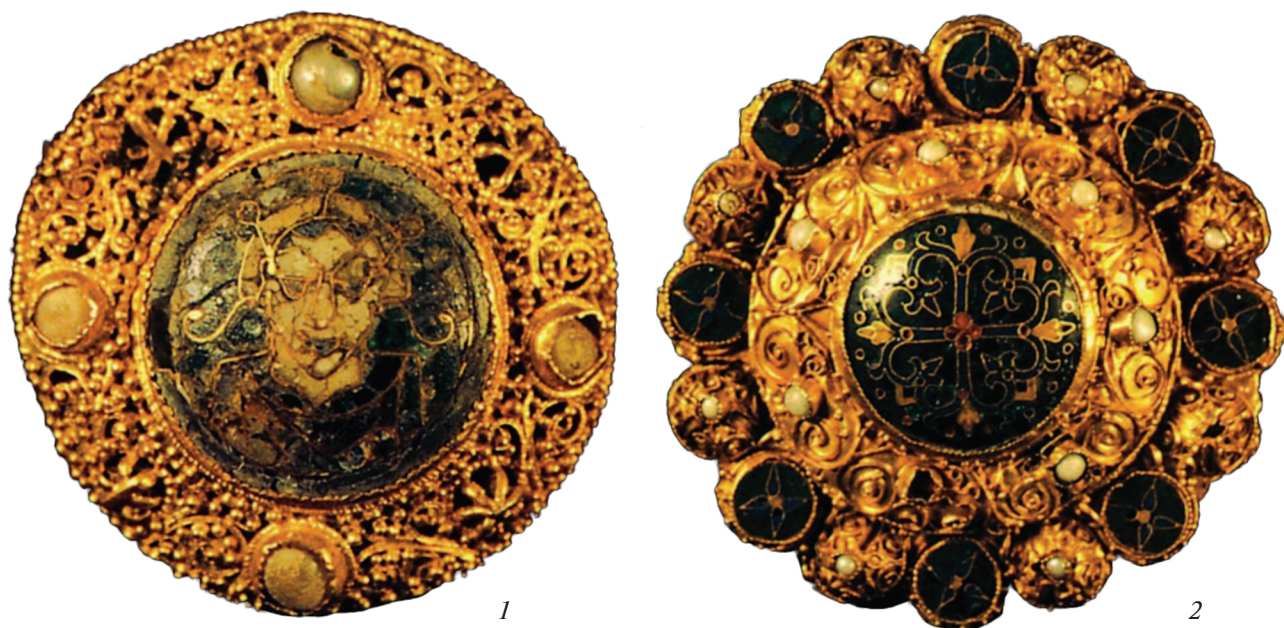
Рис. 4. Золотые фибулы из Британского музея (по: Ogden, 1993). 1 – ранний XI в.; 2 – поздний X–XI в. Fig. 4. Gold fibulae from the British Museum (after Ogden, 1993)