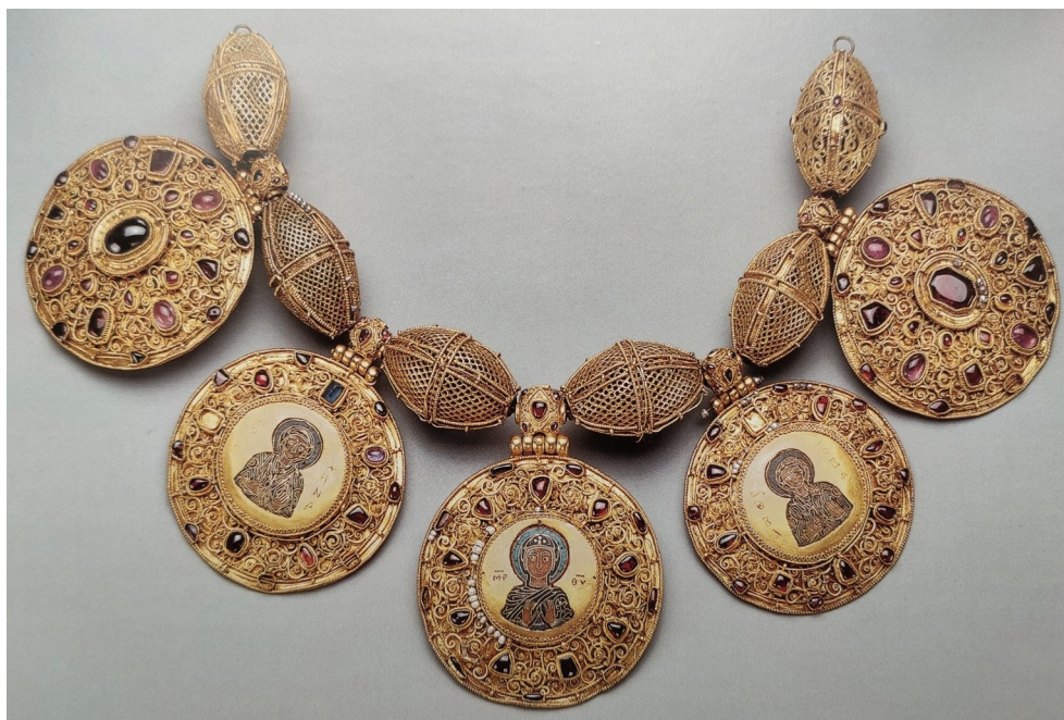
Рис. 2. Ожерелье, собранное из медальонов и бусин Старорязанского клада 1822 г. Музеи Московского Кремля. Здесь и далее без масштаба.