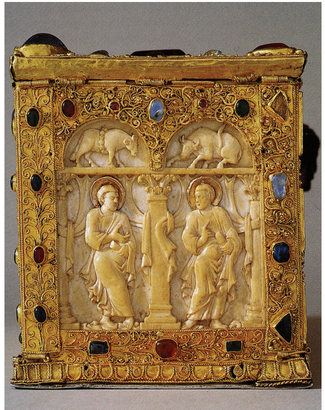
Рис. 7. Реликварий святого Серватия. Резные рельефы — около 870 г., золотой филигранный оклад — около 1200 г. Муниципальный музей, Кведлинбург (по: Garrison, 2020).

Филигрань реликвария, как и бусины недошедшего до нас императорского пояса, а также другие близкие к ним драгоценности эпохи Оттона IV (Junghans, 2008) позволяют предположить, что в Рязани в конце XII — первой четверти XIII в. мог работать мастер из германских земель, создавший грандиозный ансамбль украшений и включивший в него более ранние перегородчатые