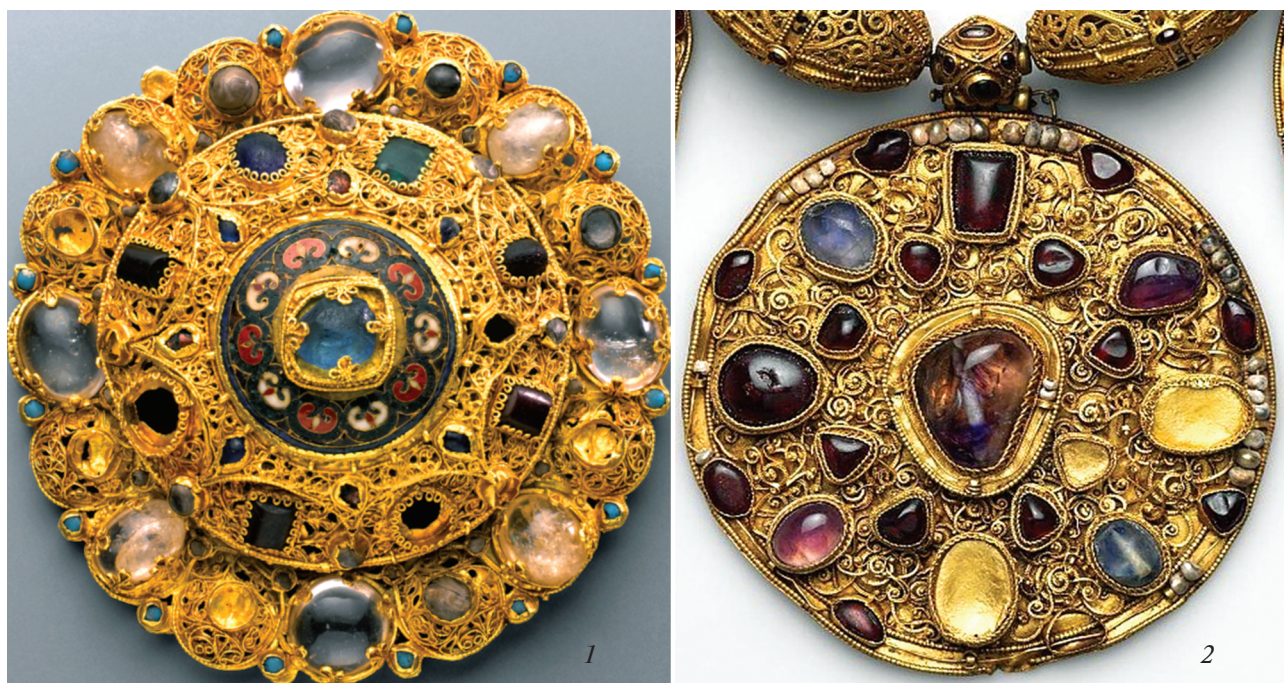
Рис. 5. Золотая фибула (1) из Сокровища Гизелы и медальон (2) из Старорязанского клада 1822 г. 1 – первая половина XI в. Государственные музеи Берлина, Музей декоративно-прикладного искусства (по: Wolters, 2016); 2 – около 1200 г. Музеи Московского Кремля.