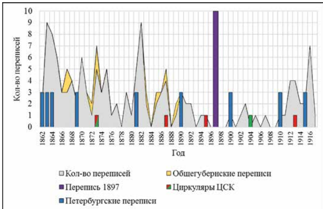
Рис. 2. Хронология, частота и контекст проведения городских переписей. Составлено по: Волков А.Г. Указ. соч. С. 557.

Сопоставление дат циркуляров и динамики количества переписных мероприятий позволяет предположить, что если первый циркуляр вследствие своей «мягкости» практически не повлиял на настроения региональных акторов, то последующим двум предписаниям удалось затормозить рост интереса к проведению городских переписей, который Россия переживала на протяжении почти 30 лет. Либеральный циркуляр № 201 от 1904 г., в свою очередь, не вызвал большого энтузиазма у местных статистиков, так как, по предположению Гессена, многие видные региональные практики отошли от дел, разочаровались или стали излишне осторожными из-за предыдущих запретительных актов 28 . Свою роль сыграла и перепись 1897 г., которая на время удовлетворила потребность местных властей в данных о населении. Ситуацию усугубили военно-политические потрясения и экономический кризис, поразивший Россию в начале XX в. В этих условиях муниципалитеты вынуждены были сознательно экономить на отнюдь не дешёвых статистических обследованиях. Запретительный эффект последнего циркуляра ЦСК от 1913 г. оказался фактически сведён на нет Первой мировой войной, в результате которой многие российские города начали испытывать массовый приток беженцев и дефицит продовольствия, что как никогда обострило потребность в учёте населения.