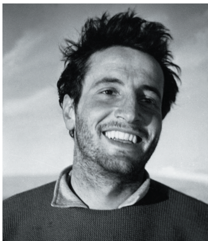
Клод Лориус, 1955 г. Claude Lorius, 1955

21 марта 2023 г. не стало Клода Лориуса — замечательного ученого, полярника, исследователя Антарктиды и Гренландии.