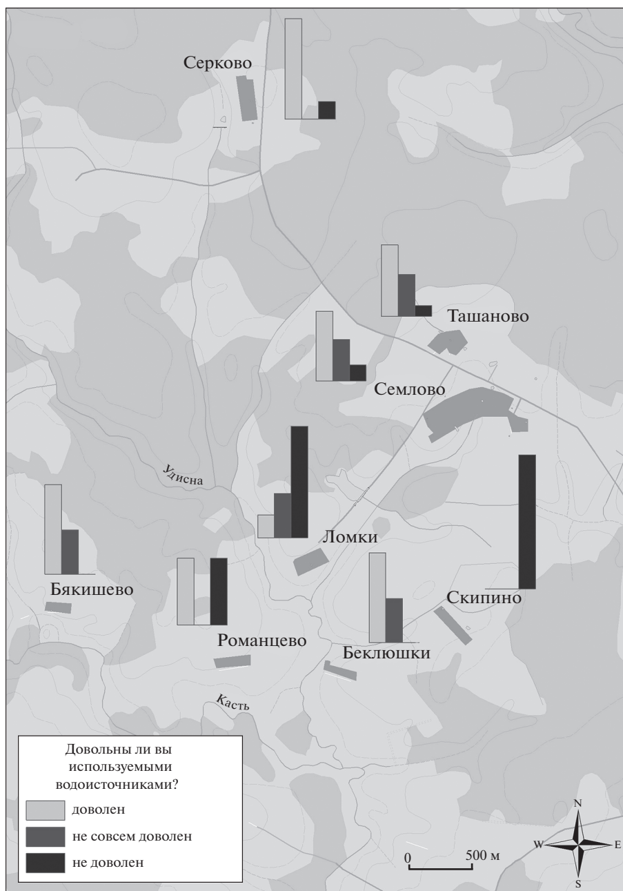
Рис. 2. Результаты обобщения ответов домашних хозяйств на вопрос: “Довольны ли вы используемыми водоисточниками?” в 2019 г.

с существенной дифференциацией по населенным пунктам (рис. 2).