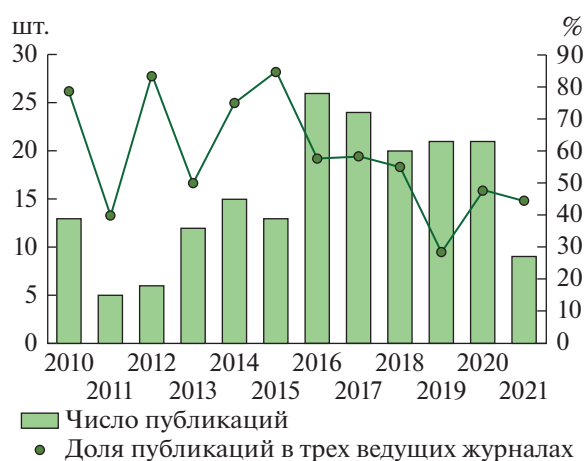
Рис. 1. Динамика публикаций на миграционную тематику в ведущих российских журналах, индексируемых в РИНЦ по “Географии”. Составлено Л.Б. Карачуриной по данным РИНЦ.

“Известия РАН. Серия географическая” содержат главным образом статьи по внутрироссийской миграции, подавляющая их часть переведена и опубликована в Regional Research of Russia . Почти треть исследований затрагивает муниципальные образования. Анализ миграционных процессов на этом самом нижнем статистически доступном в России уровне позволяет констатировать усиление поляризации российского пространства под воздействием миграции: в зонах ближней к Москве пригородной массовой застройки Московской области ощутимо увеличивается концентрация населения, а жилищное строительство выступает главным механизмом стимулирования миграционного притока в Московскую агломерацию через смягчение ценового барьера на жилье (Kurichev, 2017; Kurichev and Kuricheva, 2018). Аналогичные процессы происходят в большинстве российских регионов: растет