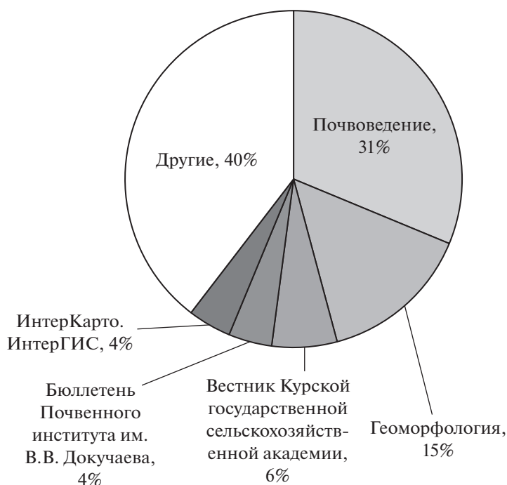
Рис. 1. Распределение работ по изданиям/журналам РИНЦ.

и обобщения почвенно-эрозионных обследований 1970–1980-х гг. и агрохимических обследований. В случае если в работе отсутствовали данные о темпах эрозии почв или новые (авторские) данные об эродированности почвенного покрова они не включались в анализ за исключением нескольких работ, относящихся к анализу факторов эрозии почв. Такие работы преимущественно приурочены к Белгородской области [35, 50, 51, 55, 62, 106]. В связи с многочисленностью не могли оставить их без внимания и отобрали наиболее репрезентативные для включения в данный обзор.