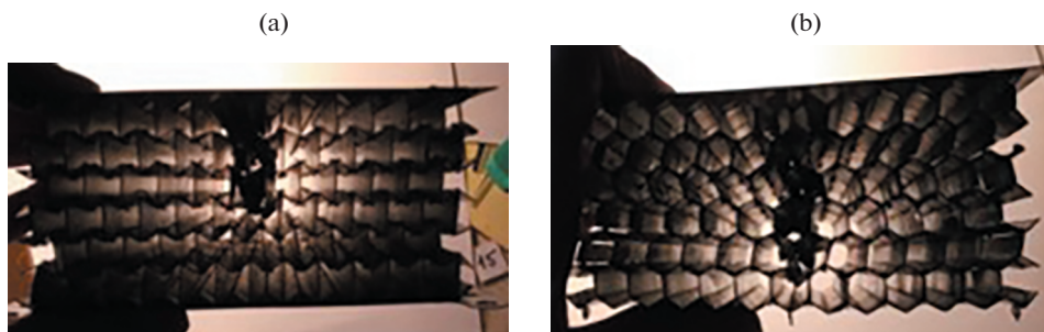
Рис. 2. Проникание ударника в ауксетический (а) и неауксетический (б) сотовые образцы в экспериментах № 1 и № 2.

В отличие от обычных материалов с положительным коэффициентом Пуассона для ауксетических материалов (материалов с отрицательным коэффициентом Пуассона) продольное растяжение приводит к поперечному расширению [1–7]. Ауксетики имеют более высокое сопротивление индентированию по сравнению с обычными материалами. Можно предположить, что данный факт может способствовать увеличению сопротивления пробиванию ударником непосредственно в месте удара, что делает ауксетики перспективными для создания ударо- и энергопоглощающих конструкций.