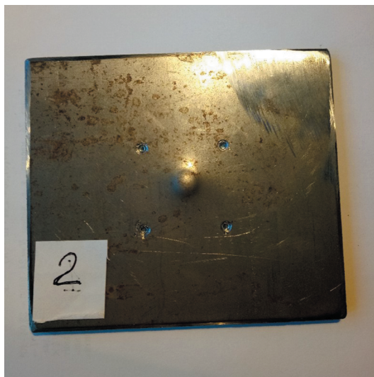
Рис. 4. Сплошная пластинка из стали после удара (эксперимент № 5).

ли толщиной 0.5 мм были изготовлены образцы метаматериала с ячеистой ауксетической структурой на основе вогнутого шестиугольника (рис. 1a,b). Для сравнения были изготовлены также образцы с сотовой внутренней структурой, не обладающей ауксетическими свойствами (рис. 1c,d). Элементом такой конструкции являлся выпуклый шестиугольник.